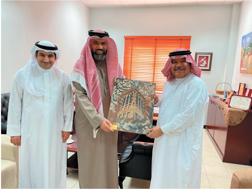
جمعية المحرق الخيرية